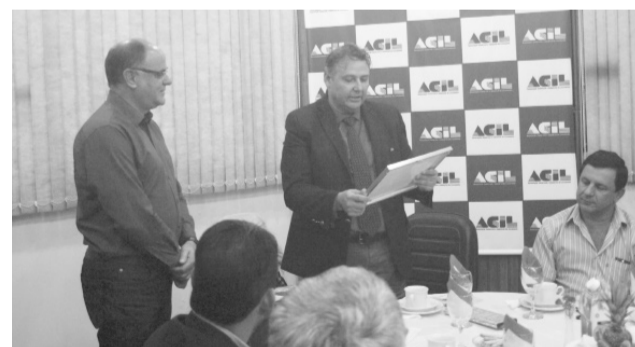
Ato foi realizado durante tradicional reunião conjunta das diretorias