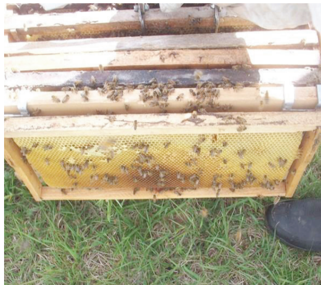
Vítima fez negócio pensando que estava comprando mel

É crime doloso, não havendo forma culposa. Há aumento na pena caso seja cometido contra entidade de direito público ou instituto de economia particular, assistência social ou beneficência.