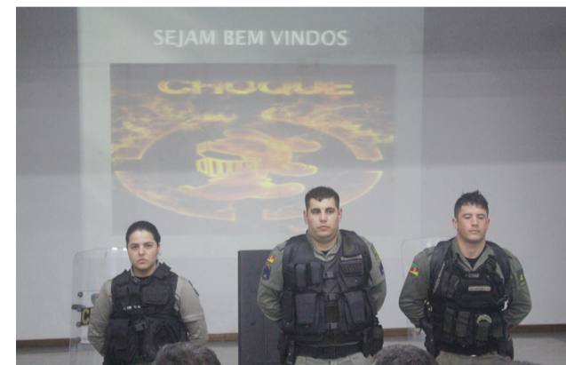
Os três novos integrantes do POE