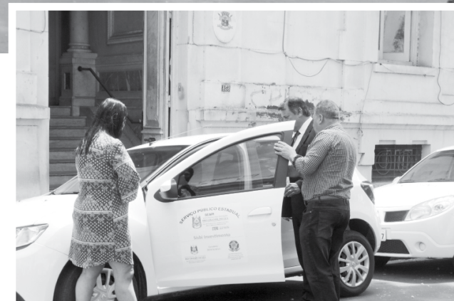
Prefeito realizando a vistoria no veículo juntamente com a vice e o secretário